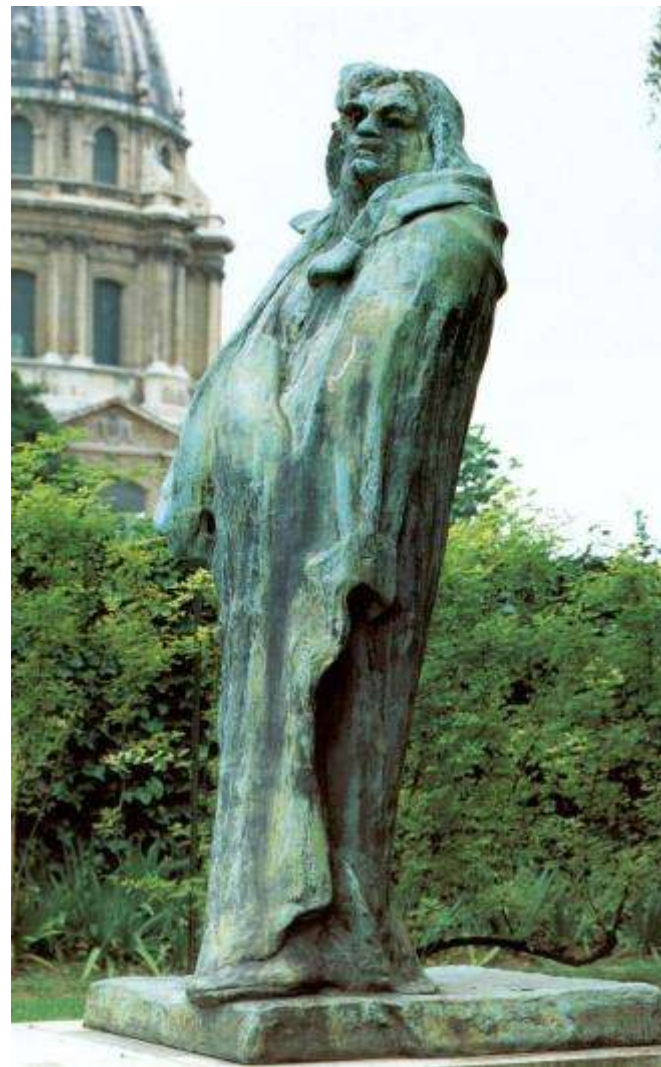
Огюст Роден. Памятник Бальзаку.