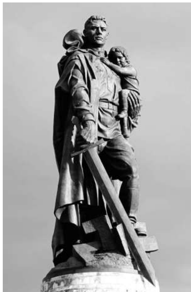
В.Вучетич “Воин-освободитель” в Трептов Парке, Берлин