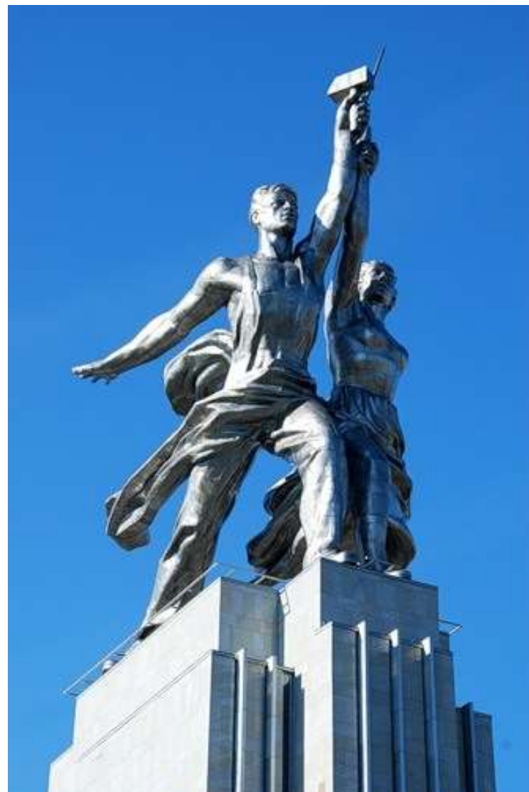
В.И.Мухина “Рабочий и колхозница”