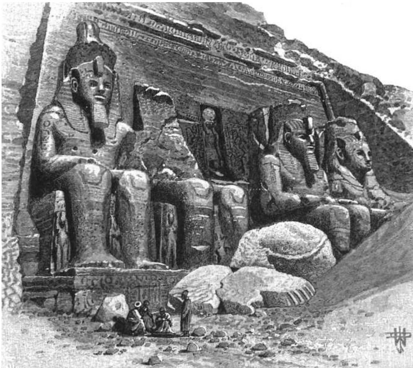
Древний Египет. Храм в Абу Симбеле.