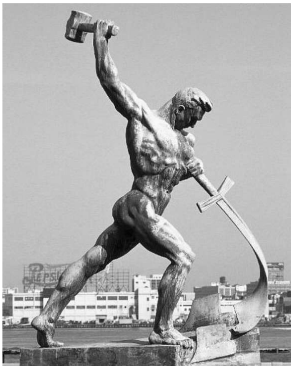
Е.В.Вучетич “Перекуем мечи на орала”