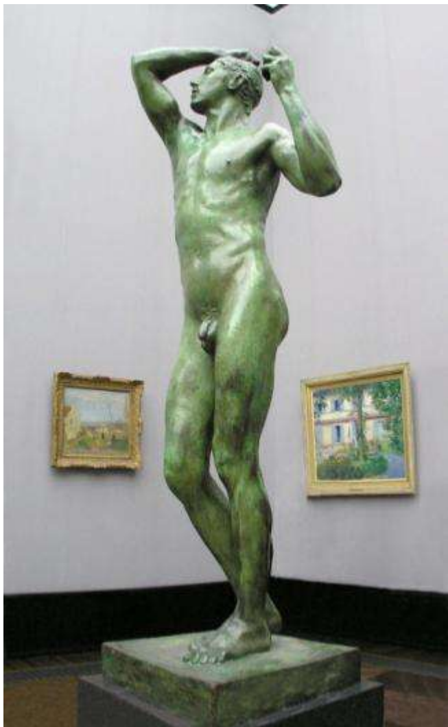
Огюст Роден. Бронзовый век.