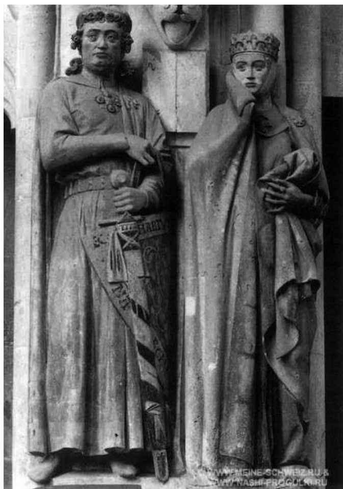
Ута и Экахарт из Наумбургского собора