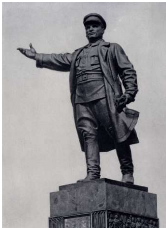
Н.В.Томский “Памятник С.М. Кирову”