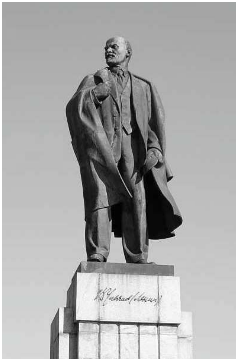
М.Г. Манизер “Памятник В.И. Ленину в Ульяновске”